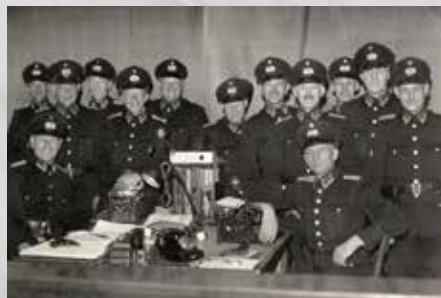
Politie Amsterdam 1943-1945

een ambtenaar of een burgemeester, uit vrees voor represailles, of met excuus van 'nog erger voorkomen', meewerkt aan de uitvoering van maatregelen, waarvan hij en wij allen weten, dat zij direct in strijd zijn met het belang van land en volk. Wat die ambtenaren niet mogen doen, is hun medewerking te verlenen om de nazificering van de scholen, mishandeling van Joden, tewerkstelling van arbeiders in Duitsland en zovele andere maatregelen, waaromtrent geen twijfel kan bestaan dat zij alleen de vijand dienen en aan onze zaak afbreuk doen.”