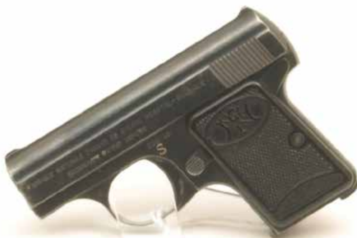
Vuurwapen FN ter illustratie