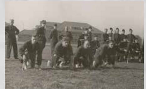
Zwart-witfoto van sportbeoefening bij het Politie-Opleidingsbataljon in Schalkhaar, 1941-1943.

De openlijk met de Nazi's collaborerende NSB had een eigen zwart-geüniformeerde paramilitaire beweging, de Weerbaarheidsafdelingen (WA).