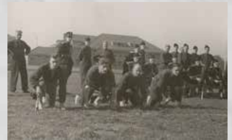
Zwart-witfoto van sportbeoefening bij het Politie-Opleidingsbataljon in Schalkhaar, 1941-1943.

De openlijk met de Nazi's collaborerende NSB had een eigen zwart-geüniformeerde paramilitaire beweging, de Weerbaarheidsafdelingen (WA).