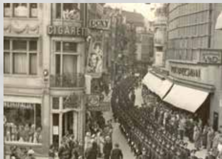
Zwart-witfoto van een mars door de stad van het Politiebataljon Amsterdam, de motordienst en de bereden brigade van het Amsterdamse politiekorps op 2 juli 1941. De foto is gemaakt in de Kalverstraat.

kader van de Bijzondere Rechtspleging werden 9 politiemensen ter dood veroordeeld en geëxecuteerd. Tientallen politiemensen kregen gevangenisstraffen opgelegd, met name nationaalsocialistische korpschefs en diensthoofden. Daarnaast ook medewerkers van speciale eenheden die Joden, onderduikers en verzetsmensen hadden opgespoord en opgepakt. Vijftien jaar na de bevrijding zat niemand meer in de cel. Zij hadden hun straf uitgezeten of kregen gratie.”