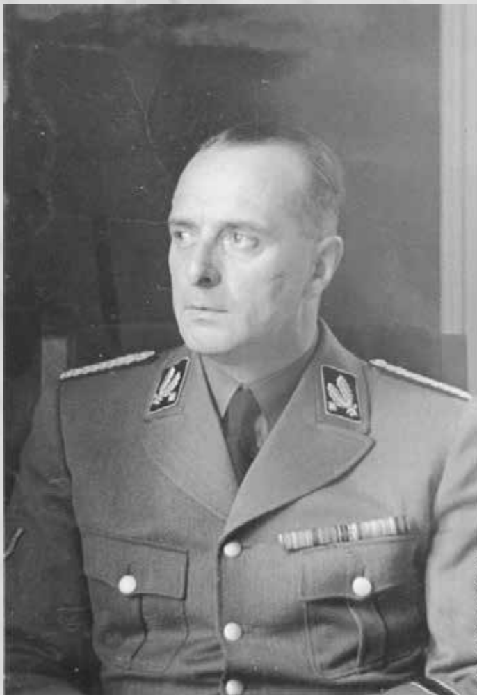
Hanns Albin Rauter