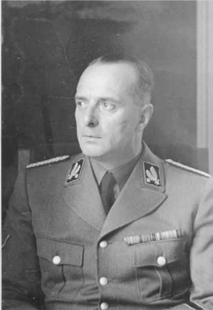
Hanns Albin Rauter