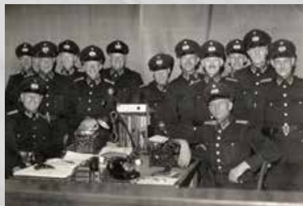
Politie Amsterdam 1943-1945

een ambtenaar of een burgemeester, uit vrees voor represailles, of met excuus van 'nog erger voorkomen', meewerkt aan de uitvoering van maatregelen, waarvan hij en wij allen weten, dat zij direct in strijd zijn met het belang van land en volk. Wat die ambtenaren niet mogen doen, is hun medewerking te verlenen om de nazificering van de scholen, mishandeling van Joden, tewerkstelling van arbeiders in Duitsland en zovele andere maatregelen, waaromtrent geen twijfel kan bestaan dat zij alleen de vijand dienen en aan onze zaak afbreuk doen.”