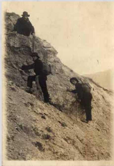
In de Zwitserse Alpen, onbekende fotograaf (1911). Beeldmateriaal uit De wereldwandelaars © Joods Historisch Museum.

beroep. In de Duitstalige gebieden, zo schreef Bram, was het gebruik dat schilders, beeldhouwers en andere kunstenaars van plek naar plek trokken – op zoek naar werk en opdrachten. Het handwerk vroeg om een leertijd in den vreemde.