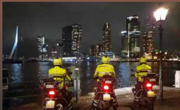
Coverfoto: Rob Hooffman

Clappers & Vlieger Media Industrieweg 94 7202 CB Zutphen Telefoon: 0575 - 47 38 81 E-mail: info@clappers-vlieger.nl Internet: www.clappers-vlieger.nl Vormgeving: Fabian Clappers Fotografie: Henk Baron, Martin van der Putten