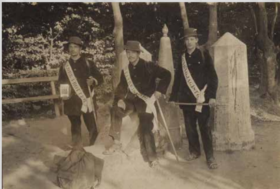
Poseren bij het Drielandenpunt te Vaals, fotograaf Johan Cohnen jr. Beeldmateriaal uit De wereldwandelaars © Joods Historisch Museum

Ze werden voor een dubbeltje geboren. Geestdriftige jonge mannen en vrouwen, twintigers, afkomstig uit volkswijken in Den Haag, Delft en Amsterdam. Ze vonden elkaar in hun idealen: geheelonthouders waren ze, vegetariërs, pacifisten, strijdend voor sociale gelijkheid en op zoek naar vrijheid in de natuur. In de zomer van 1911 vertrokken ze vanaf de Dam voor een voetreis van jaren. Onderweg deden ze voor kranten en tijdschriften verslag van hun avonturen – tot de Grote Oorlog uitbrak en de kleine karavaan in Palestina met een schok tot stilstand werd gebracht. Wim Willems beschreef hun in zijn boek De wereldwandelaars . Een verbond van idealisten, dat onlangs verscheen bij uitgeverij Querido. Op Historiek een fragment over de ‘wonderlust’ in het begin van de twintigste eeuw.