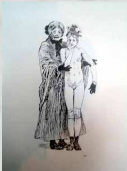
Voici, votre fille monsieur Cabanel – Félicien Rops