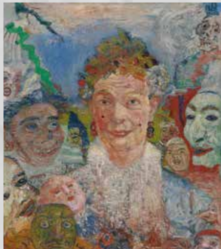
Oude dame met maskers 1899 – James Ensor (MSK Gent)