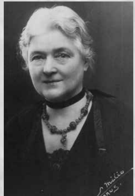
Portret van Neel Doff in een in 1943 verschenen editie van ‘Jours de famine et de détresse’

In 1911 wordt een eerste deel Jours de famine et de détresse (dagen van honger en ontredde) gepubliceerd. De korte hoofdstukjes