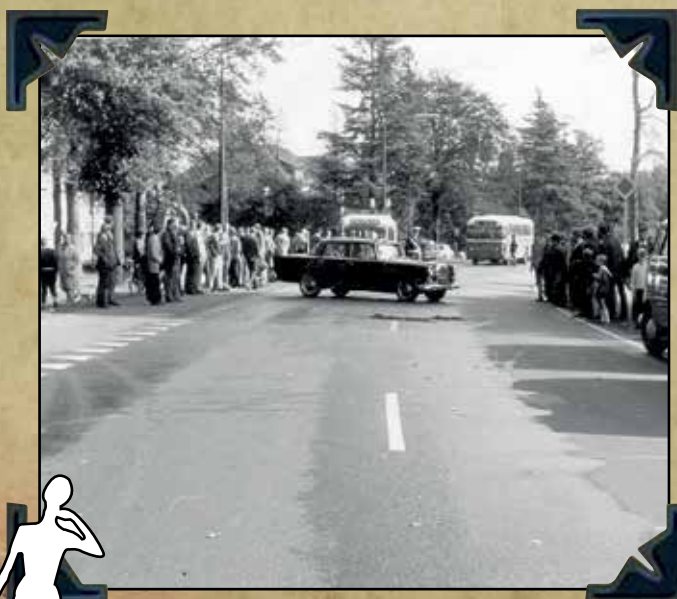
Aanrijding Driebergen bij IVA