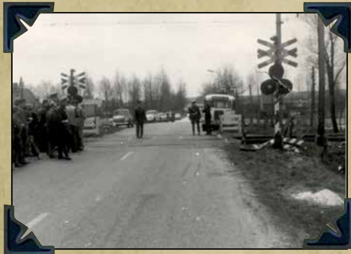
Aanrijding Rensoude GSA collega