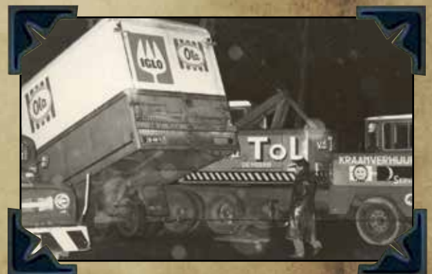
Aanrijding Iglowagen te Lopik 1967