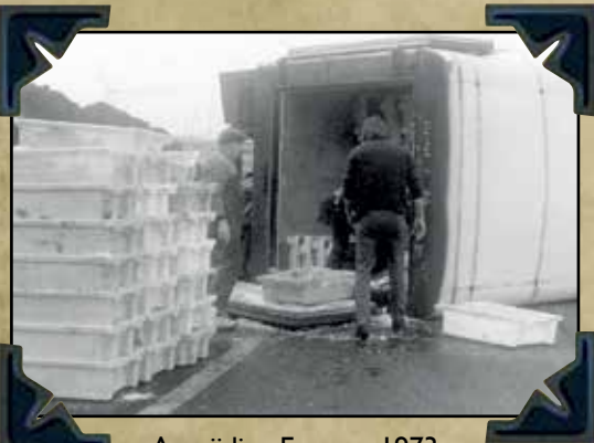
Aanrijding Eemnes 1973