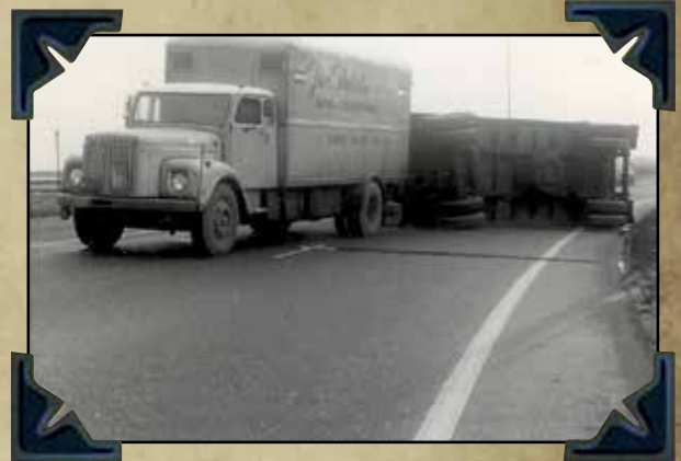
Aanrijding Eemnes 1973