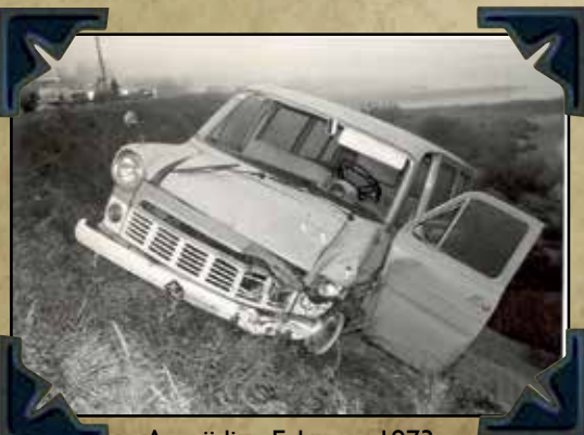
Aanrijding Erlecom 1973