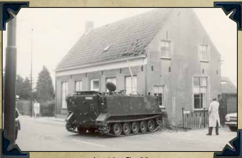
Aanrijding Elst (U)