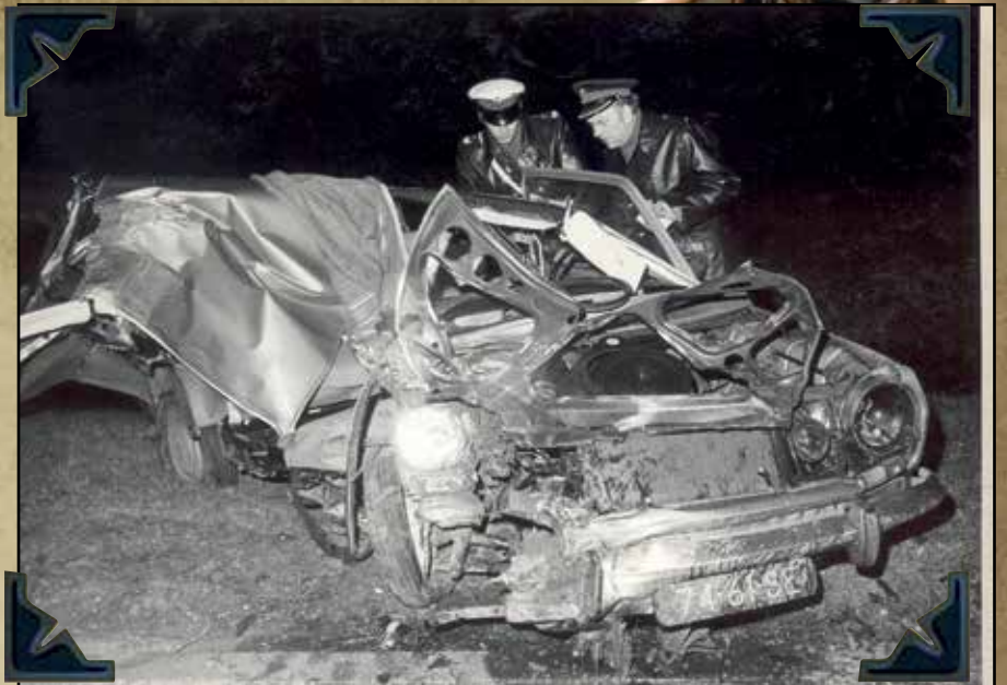
Aanrijding Benschop 14-01-1973