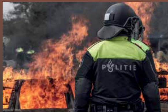
CoverFoto: Training gewenning aan vuur. Training base Weeze, Duitsland

Clappers & Vlieger Media Industrieweg 94 7202 CB Zutphen Telefoon: 0575 - 47 38 81 E-mail: info@clappers-vlieger.nl Internet: www.clappers-vlieger.nl Vormgeving: Fabian Clappers