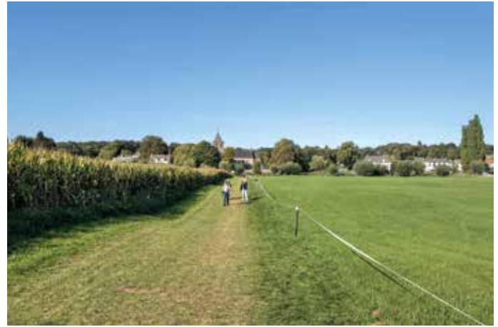
White Ribbon Mile

In de nacht van 25 op 26 september kregen de troepen die gevestigd waren in Hotel Hartestein, het hoofdkwartier van gen Urquhart, de opdracht om zich terug te trekken over de Rijn (operatie Berlijn). Dat moest in de nacht gebeuren om niet de aandacht van de vijand te trekken. Omdat het erg regende en pikdonker was, werden er witte linten gespannen die de route naar de Rijn markeerden. Om dat ook nog stil te doen werden er sokken over de schoenen getrokken. Ze liepen van de Hartestein via de oude Kerk door de uiterwaarde naar de Rijn. Die nacht werden 2300 man overgezet met bootjes van de Britse en Canadese Genietroepen. Een klein monument aan de oever van de Rijn herinnert aan die overtocht. Tijdens die overtocht werden ze beschoten vanaf de Westerbouwing. Er vielen doden en ook verdronken er militairen die probeerden over te zwemmen. De onderstroom van de Rijn is erg sterk.