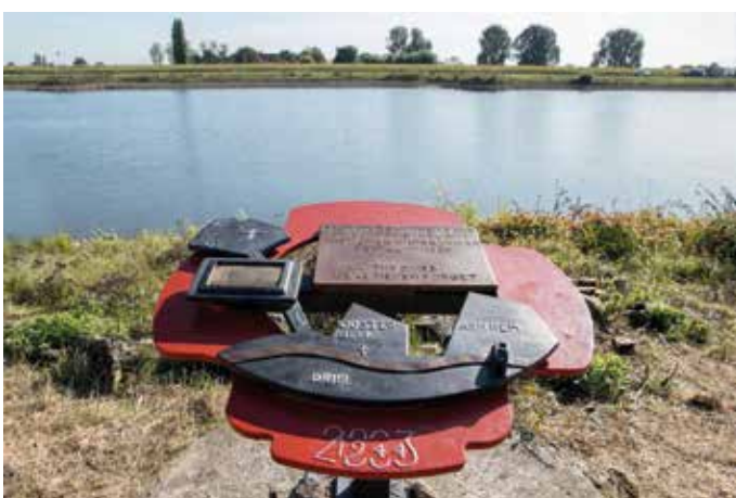
Monument aan de oever van de Rijn