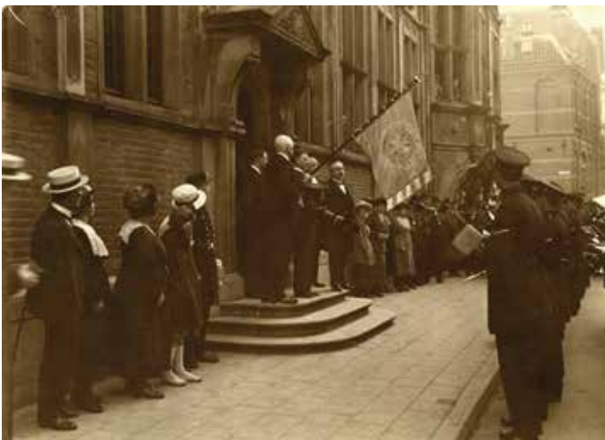
Aanbieding van het eerste vaandel, 31 augustus 1921.

Dat de haan als symbool van de A.P.M.V. is gebruikt is mogelijk herleidbaar naar de historisch-culturele uitleg dat het symbool van de haan het teken is van de komst van het initiatieke licht. In de oudheid was hij het zonnedier (aan de zonnegod Apollo gewijd). Dat symbool komt in alle beschavingen voor, die met de zon en met licht in verband worden gebracht, omdat de haan de dageraad aankondigt en de demonen van de nacht verjaagt. De haan staat voor waakzaamheid en strijdbaarheid. (Wikipedia).