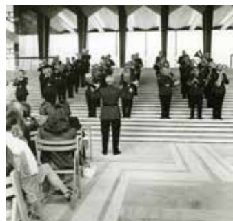
De officiële openingshandeling

Het 50 jarig bestaan werd groots gevierd met een Nationaal Politie Muziekfestival op de Markt voor het Gelderse Provinciehuis. Helaas is hier geen verdere documentatie van gevonden.