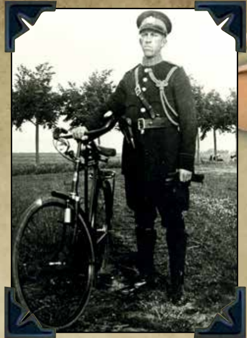
Patrouille op de fiets