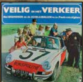
Bromsnor en de AVD - Veilig in het verkeer. - 1973