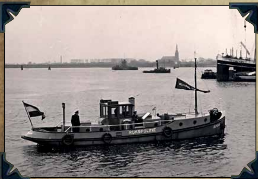
RP 59 - Bouwjaar 1935