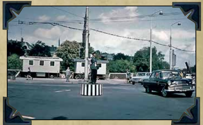
Verkeer regelen op een kruising in Groningen - 2