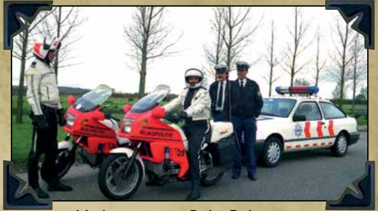
Verkeersgroep Rijks Politie Nijmegen