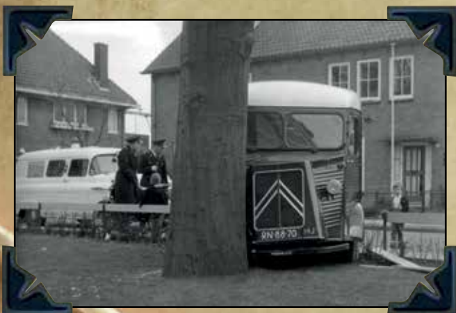
Ongeval met de Citroen HY