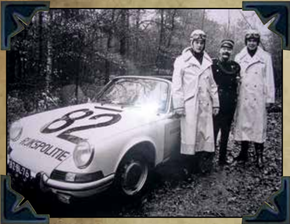
Algemene Verkeersdienst RP met Bromsnor uit de TV serie Swiebertje