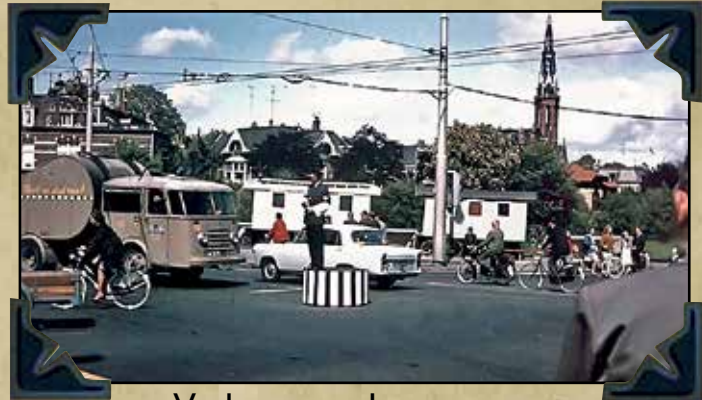
Verkeer regelen op een kruising in Groningen - 1