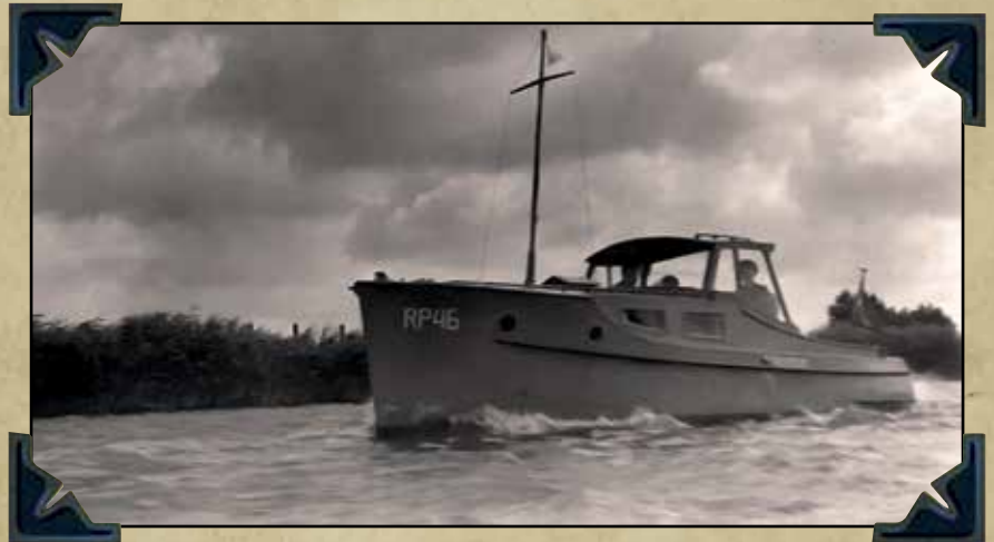
RP 46 - Bouwjaar 1942