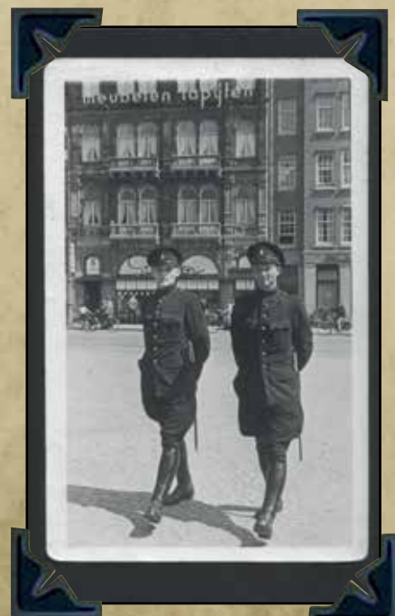
Amsterdamse politie - 1940