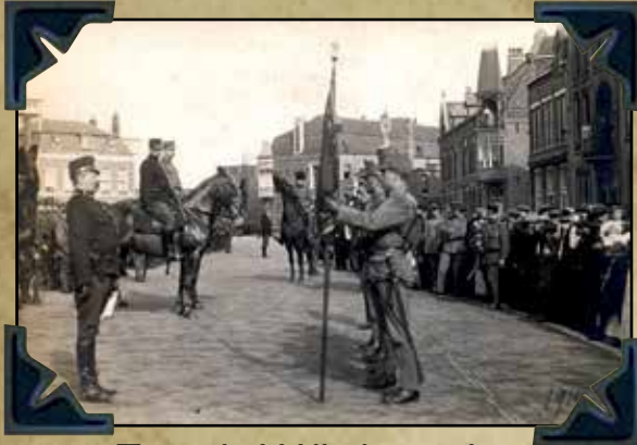
Toezicht Wilhelminaplein Eindhoven - 1916