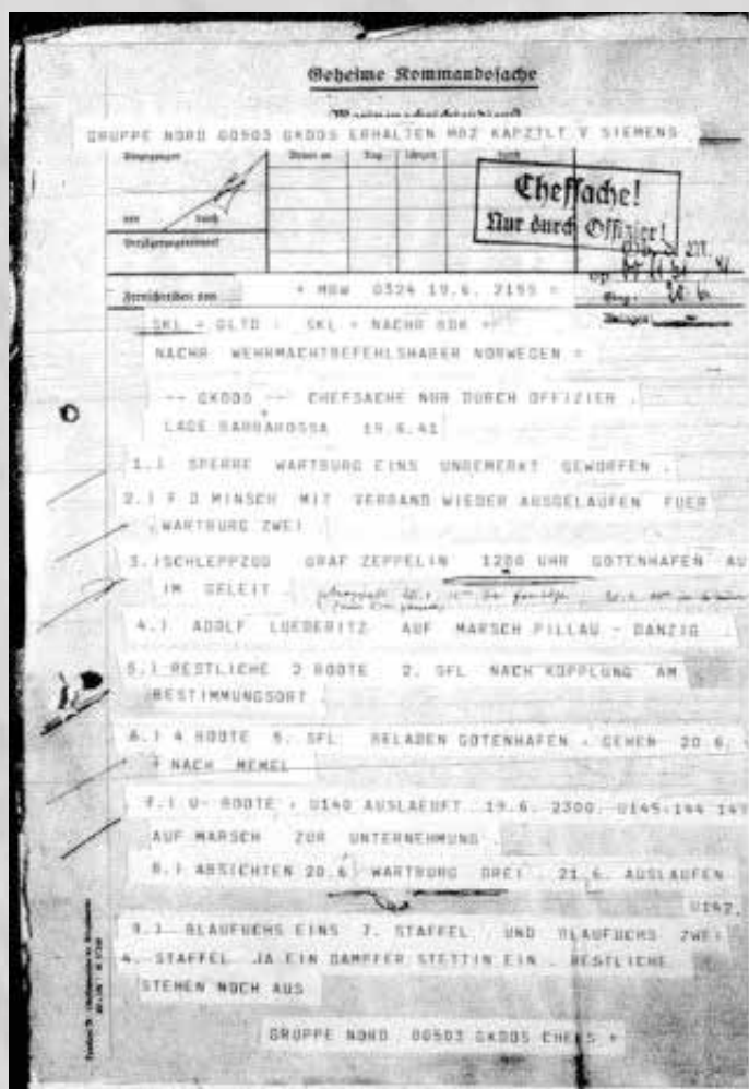
Een van de tienduizenden buitgemaakte documenten. Dit gaat over de voorbereiding van de aanval op de Sovjet-Unie. (US National Archives, identifier 7431812)

Om de archiefstukken uit Slot Tambach weg te halen stelde generaal Patton vrachtwagens beschikbaar. Maar verder is de geschiedschrijving over de verhuizing nogal verwarrend, vooral over hoeveel materiaal veilig is gesteld.