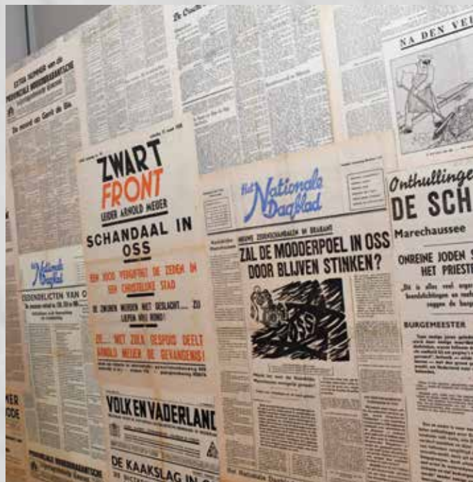
Tot eind jaren 30 vorige eeuw blijft Oss in de belangstelling van de nationale pers. De politieke signatuur van de afgebeelde kranten zo vlak voor de oorlog zal zeker een rol hebben gespeeld.

verschillende leden uit de genoemde families berecht en tot gevangenisstraffen veroordeeld. De marechaussee werd door koningin Wilhelmina voor hun optreden koninklijk onderscheiden. Mooi natuurlijk, maar in de nasleep kwam men op het spoor van andere misdaden en hier werd ook onderzoek naar gedaan. De onderzoeken betroffen zedenschandalen en fraudezaken, waarbij de elite van het dorp en zelfs de geestelijkheid betrokken zou zijn. Een onderzoek dat volgens velen te ver ging en van hogerhand werd het onderzoek stilgelegd dan wel onmogelijk gemaakt. Het leidde er toe dat marechaussees werden overgeplaatst en uiteindelijk tot de val van het vierde kabinet Colijn.