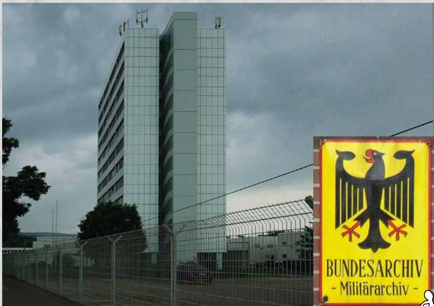
Het gebouw van het Bundesarchiv-Militärarchiv in Freiburg waar nu het originele, in Slot Tambach aangetroffen Duitse marine-archieef is ondergebracht.