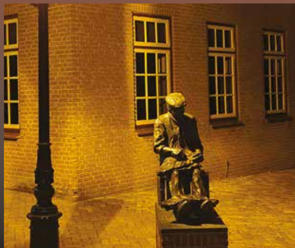
Coverfoto : Martin van der Putten

Clappers & Vlieger Media Industrieweg 94 7202 CB Zutphen Telefoon: 0575 - 47 38 81 E-mail: info@clappers-vlieger.nl Internet: www.clappers-vlieger.nl Vormgeving: Fabian Clappers Fotografie: Henk Baron, Martin van der Putten