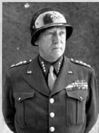
Generaal Patton in 1945

THE BEARER OF THIS CARD WILL NOT BE INTERFERED WITH IN THE PERFORMANCE OF HIS DUTY BY MILITARY POLICE OR ANY OTHER MILITARY ORGANISATION (De drager van deze kaart zal bij de uitoefening van zijn plicht niets in de weg worden gelegd door de militaire politie of enige andere militaire organisatie)