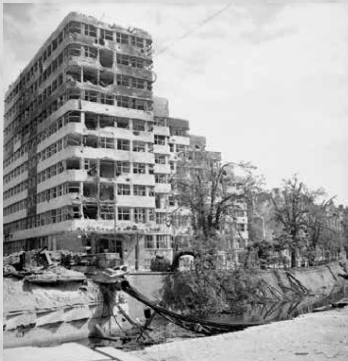
Shell-Haus aan de Tirpitzufer (tegenwoordig Reichpietschufer) in Berlijn in 1945. Hier was het marine-archief weggehaald.

Fraai is wat historicus K.W.L. Bezemer in zijn oorlogsgeschiedenis over de Nederlandse koopvaardij (1987) vertelt over wat er vervolgens gebeurde. Hij baseert zich overigens op het ongepubliceerde proefschrift van zijn Amerikaanse vakgenoot Allison W. Seville. Het staflied in Slot Tambach dat verantwoordelijk was voor de eventuele vernietiging van het archief moest in februari en maart in het Noord-Duitse Sleswijk zijn voor een congres voor reserve-officieren. Toen hij begin april terug wilde naar Tambach lukte dat niet door de snelle geallieerde opmars. Het overige personeel in het slot greep zijn afwezigheid aan om het hout op te stoken in de eigen kachels en eigen auto's te vullen met een deel van de benzine. Een vluchtende SS-eenheid vulde de benzinetanks van het konvooi met de resterende brandstof. Het archief in geval van nood vernietigen, was daarmee onmogelijk geworden.