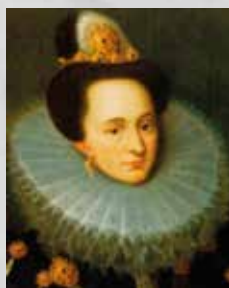
Maria van Nassau

*Breda 7 februari 1557 † Buren 16 oktober 1616