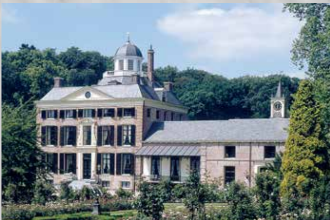
Kasteel Rosendaal Rosendaal 1 6891 DA Rozendaal www.glk.nl/r

Op het mooi gelegen landgoed Verwolde staat een edelmanshuis omringd door een tuin, park en het bosgebied Oranjewoud met vijvers en landbouwpercelen. Huis Verwolde is met een gids te bezoeken. De tuin en het bos zijn vrij toegankelijk; de rest van het landgoed is nog particulier bezit van de familie Van der Borch.