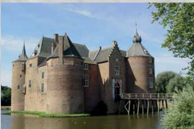
Kasteel Ammersoyen Kasteellaan 1 5324 JR Ammerzoden www.glk.nl/ammersoyen

Landgoed Rosendaal ligt in Rozendaal, vlakbij Arnhem. Het bestaat uit een imposant en historisch ingericht kasteel in een park met veel bezienswaardigheden. Kasteel Rosendaal geeft een mooi beeld van hoe er vroeger op een kasteel werd geleefd. Er is een bijzondere collectie meubels, zilver en porselein te zien.