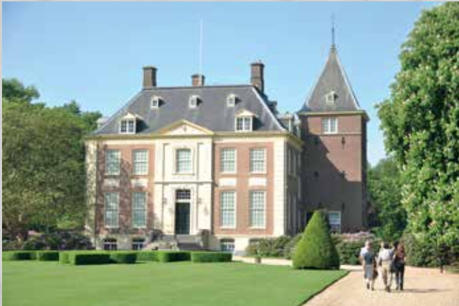
Huis Verwolde Jonker Emilelaan 4 7245 TL Laren www.glk.nl/verwolde

De kasteelheer van genoemde kastelen en landhuizen biedt de leden van IPA Nederland en in het bijzonder de leden van IPA Nijmegen e.o., op vertoon van uw IPA legitimatiebewijs, een korting van 25 % op de toegangsprijs p.p. aan. Deze actie gaat in op 1 april 2015. Deze korting is niet van toepassing op andere acties en tijdens evenementen. De korting is niet inwisselbaar tegen contanten.